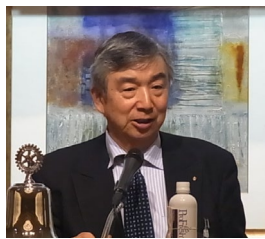
卓話紹介：西澤会員