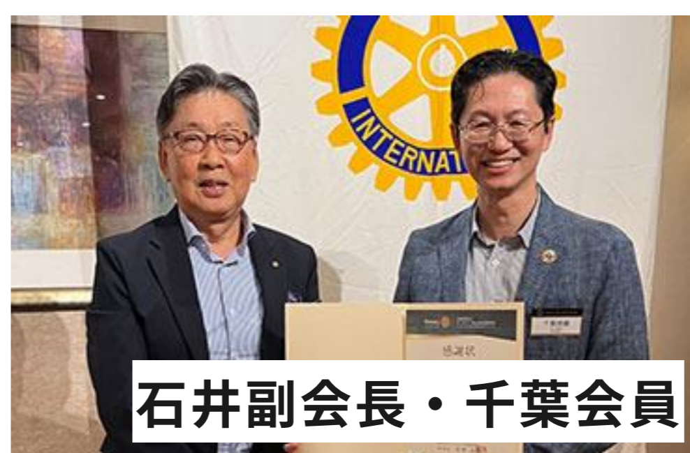
石井副会長・千葉会員