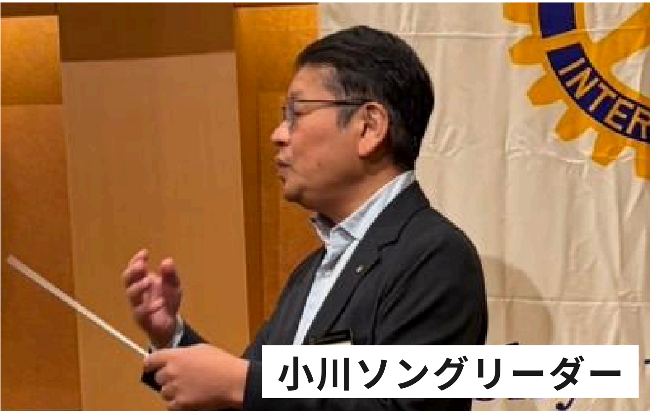
小川ソングリーダー