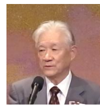
ソングリーダー 清水会員