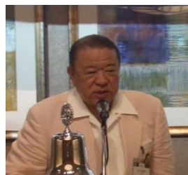
紹介者 : 岩上会員