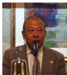
紹介者 : 長谷川会員