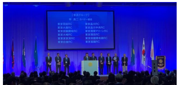
(上・右) 本会議の様子