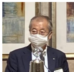
ご紹介者：穂苅会員