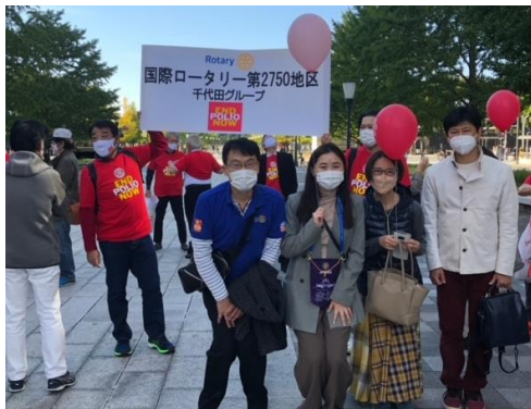
10/24 RI2750 地区