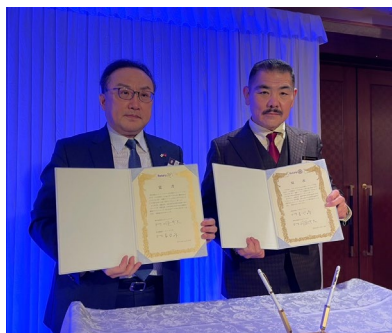
友好クラブ締結仮調印式