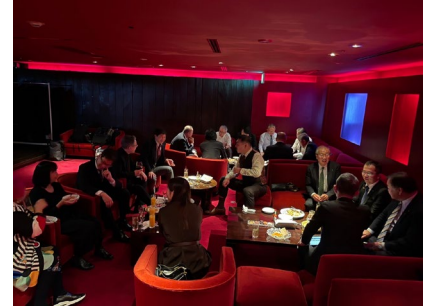
二次会 21 時～ 赤坂ジパング スーパーダイニング