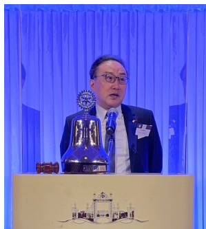
台北東海 RC Sama 直前会長