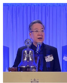
台北東海 RC ご紹介 台北東海 RC 勝山会員