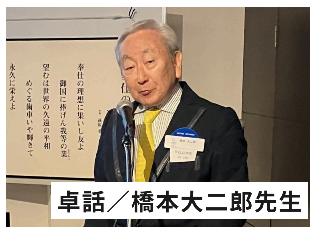
卓話／橋本大二郎先生

を静かに、しかし力強く語られる先生のお話は、私たちが日々の奉仕活動を見つめ直すうえでも大変学びの多いものでした。（文責:石井敬介）