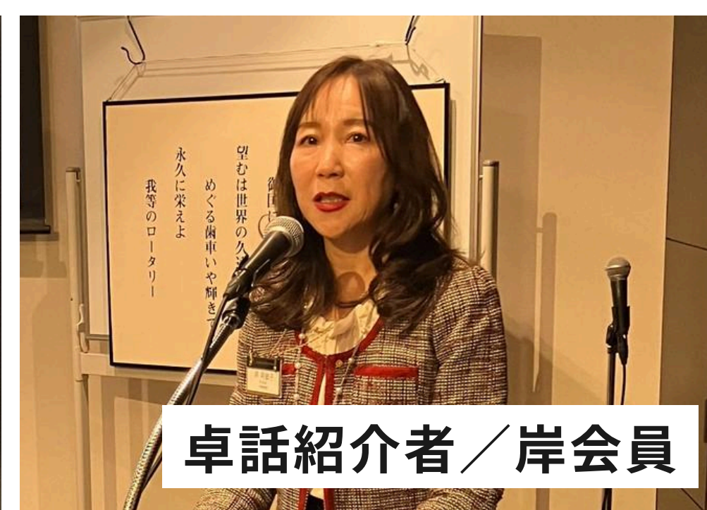
卓話紹介者／岸会員