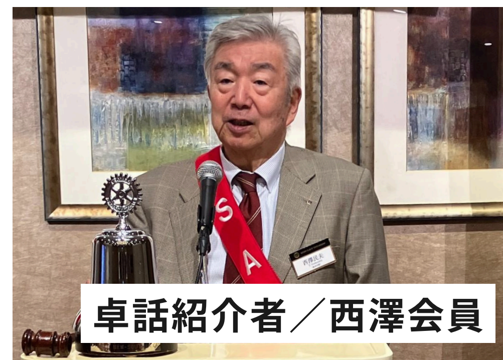
卓話紹介者／西澤会員

11/12 IMへ参加いたしました。当クラブの参加者は3名と少なかったのですが、来年40周年を迎えますので、千代田Gでも存在感を出していければと思います。地区より100% 100ドル寄付達成のバナーをいただきました。