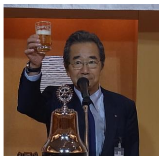
乾杯：尾関前年度会長