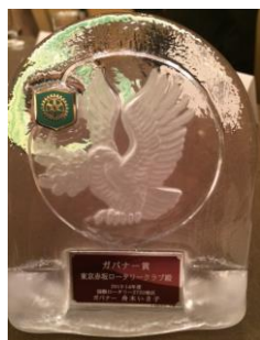
ガバナー賞 (みなと区キッズフェスタ)

その他： 新しい風賞（R財団三冠達成） ・ 1人150ドル（年次寄付） ・ ベネファクター（1,000ドル） ・ ポリオ寄付（1,000ドル）