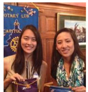
Capitol Hill Rotary Club と旗の交換