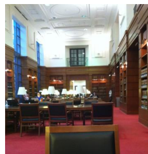
図書館の様子 (午前2時に閉館です)

Rotary Club of Washington D.C.の例会ではテロリズムの予防についてのとても興味深い卓話を聞くことができました。