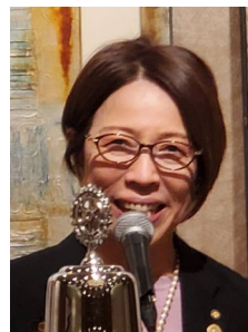
紹介者：中森副会長