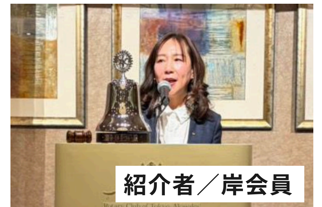
紹介者 / 岸会員