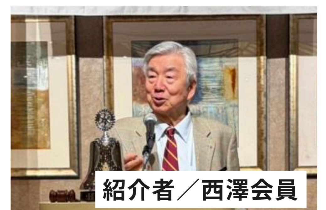
紹介者 / 西澤会員